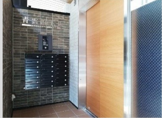
セキュリティを重視したオートロックのエントランス