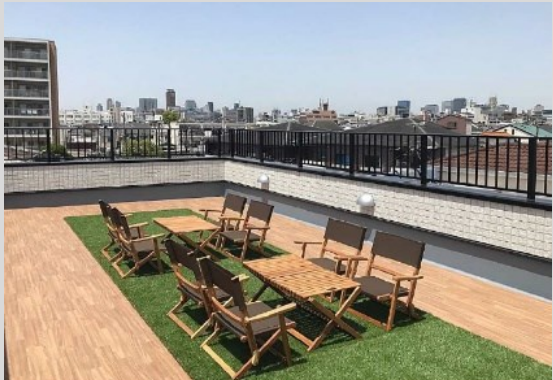
気分転換できる、開放的な屋上テラス