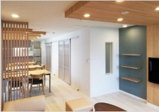
コミュニティスペース（リビング・ダイニング・キッチン）