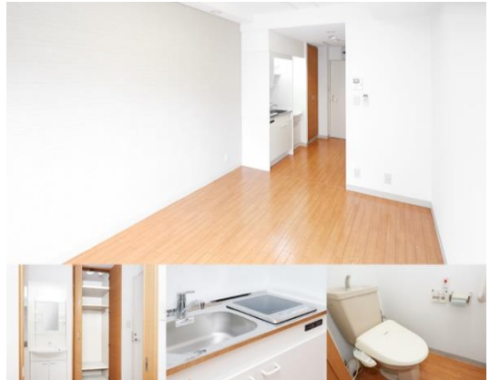
※画像は「寿らいふときわ台」です。