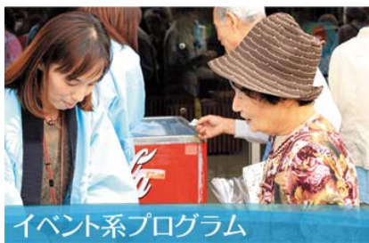
イベント系プログラム