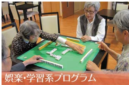
娯楽・学習系プログラム