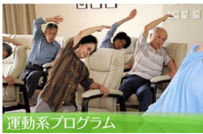
運動系プログラム