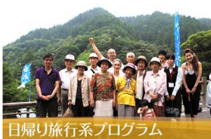
日帰り旅行系プログラム

注) 上記、設備およびサービス内容は、今後の運用により一部見直しを行うことがあります。