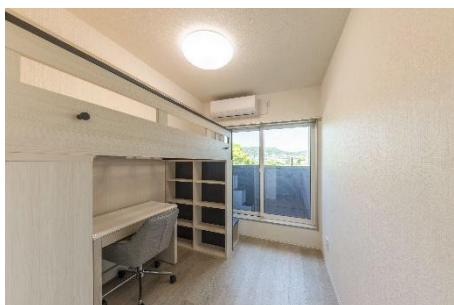
家具・Wi-Fiを完備した個室

徒歩8分の距離には就労先となる当社グループの介護施設が位置し、職住近接した環境で通勤の負担が少なく、無理なく仕事と生活を両立できるロケーションです。建物は、豊富な実績を持つ木造アパートの開発ノウハウを活かし、母国の開放感や日本の豊かな自然を感じられる快適な居住空間を目指しました。セキュリティを重視したオートロックのエントランスに加え、仲間との交流を深める共有のコミュニティスペースを確保し、各個室にはあらかじめ家具やWi-Fi環境を完備することで、プライベートな空間を確保しつつ、母国との通信やオンライン学習等もストレスなく行える環境を整えております。