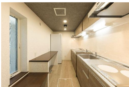
キッチンスペース